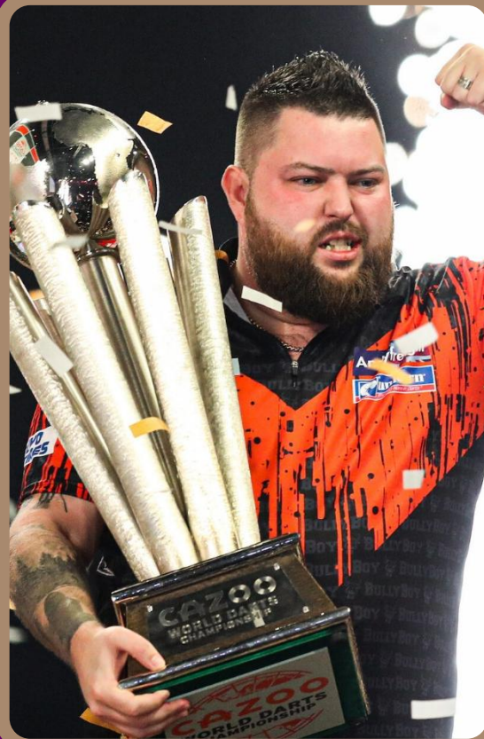
Mickael SMITH - ANG « Bully Boy »/N°31 mondial Champion du monde 2023