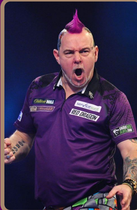
Peter WRIGHT - SCO « Snakebite »/N°32 mondial Champion du monde 2020 et 2022