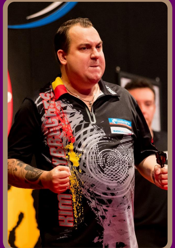
Kim HUYBRECHTS - BEL N°56 mondial « The Hurricane »